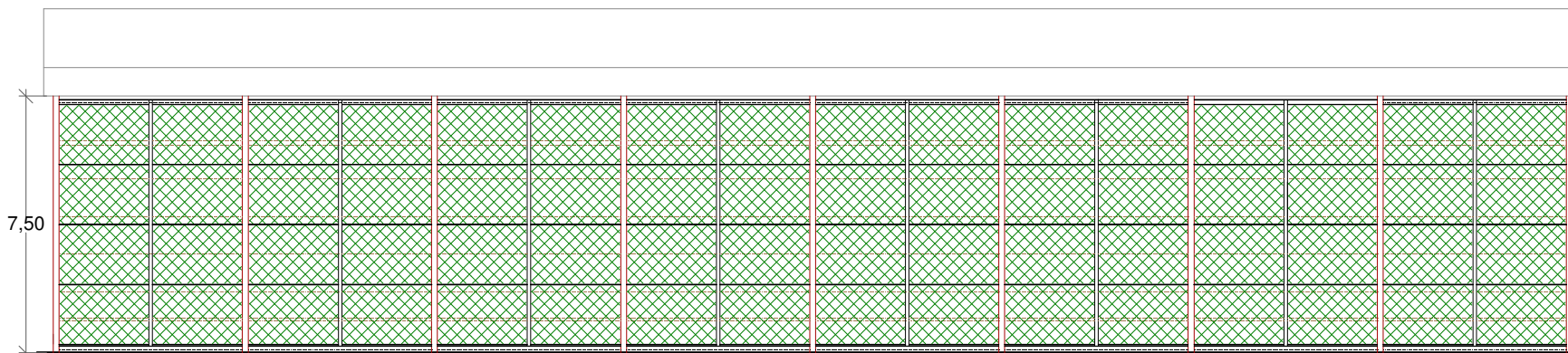
FAÇANA NORD-OEST E: 1/200